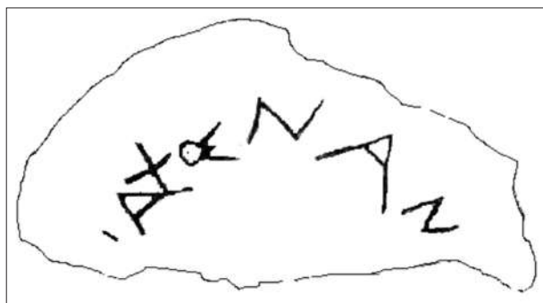
Рис. 4. Факсимиле граффито из Нимфея.

в контексте добродетели, связанной с речью; Аристотель рассматривает добродетель правдивости в общении и выделяет два противоположных недостатка: болтливость и скупость на слова [Stavniuk 2002]. В трактате «Характеры» Теофраст [Θεόφραστος; «Χαρακτήρες»] описывает различные типы человеческих характеров. В разделе о пустословии он отмечает, что пустословие – это склонность к изнурительно длинным и необдуманым речам, и описывает человека, который, садясь рядом с незнакомцем, начинает расхваливать свою