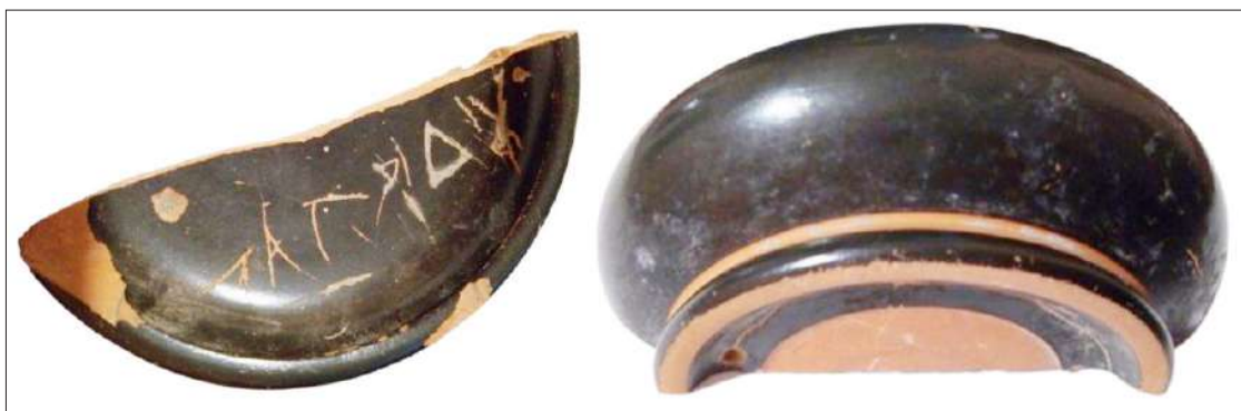
Рис. 1. Фрагмент чернολаковой чашки с граффито.