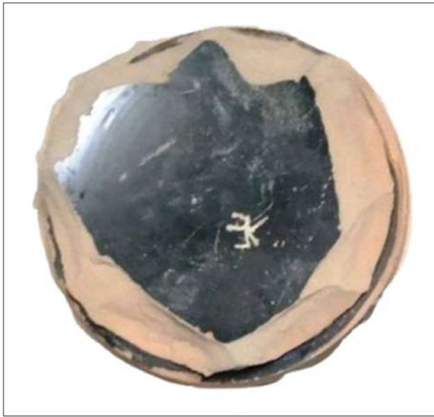
Рис. 5. Фрагмент килика с граффито из хоры Ольвии.

Fig. 5. Fragment of a kilik with graffito from the chora of Olbia.