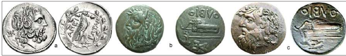
Рис. 7. Монетные монограммы из различных центров: а – Лисимах; б – «борисфен» №13 [Karyshkovskii 1988, 81]; с – «борисфен» №14 [Karyshkovskii 1988, 81].