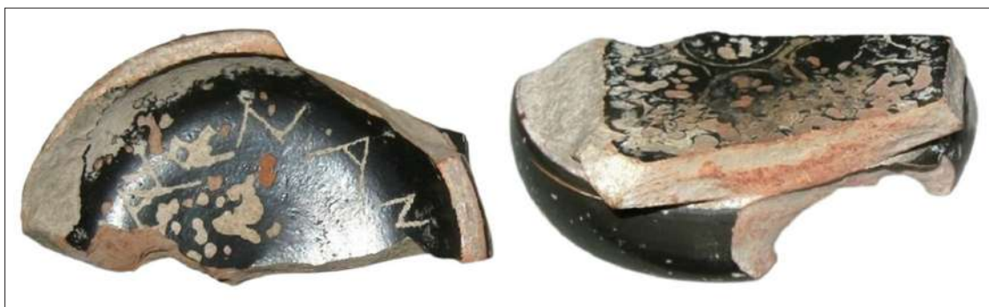
Рис. 3. Фрагмент килика с граффито из Нимфея.