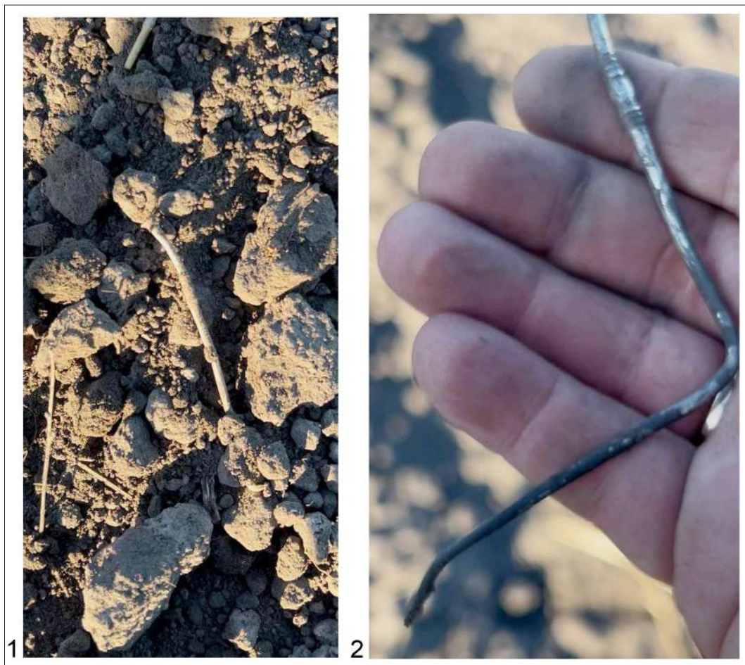
Рис. 1. Серебряная булавка в момент находки: 1 – на пахоте, 2 – первоначальный вид в изогнутом состоянии.