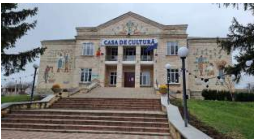
Fig. 4. Casa de cultură din s. Bardar, r-nul Ialoveni, 1968. 2024.