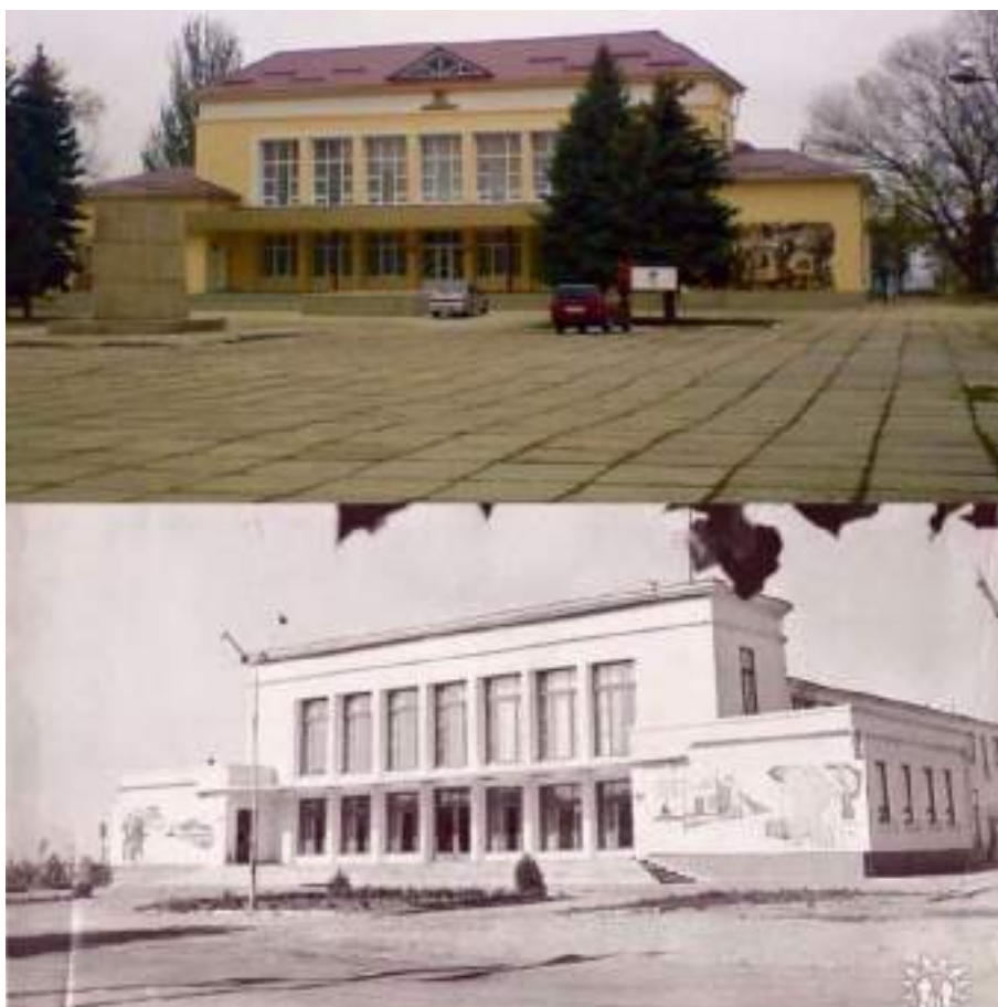
Fig. 10. Casa de cultură din or. Leova. a) 2019; b) 1967 ( https://primarialeova.md/2019/03/19/poze-orasul-leova/image-4-8/ ).