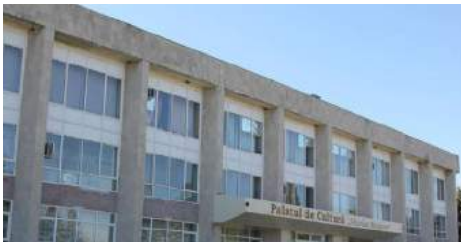
Fig. 9. Palatul de cultură din or. Cahul. 1984 ( https://ziuadeazi.md/stiri/republica-moldova-sarbatoreste-35-de-ani-de-la-adoptarea-drapelului-de-stat/ ).