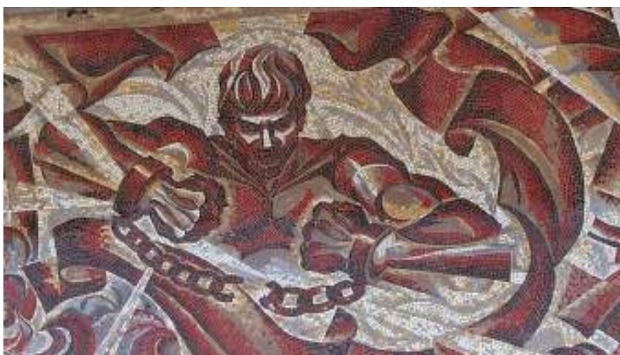
Fig. 8. Casa de cultură din s. Mocra, r-nul Râbnița. Mozaicul „Deșteptarea”. Autori: A. Kuzmin și I. Tăburța. 1977 ( http://rnovosti.info/novosti/2022/03/v-tsvetnom-oskolke-tselaya-epoha/ ).