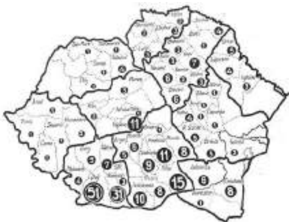
Fig. 1. Așezămintele culturale ale României Mari. Distribuția pe județe în primul trimestru al anului 1939. Apud: Căminul Cultural , octombrie 1939.