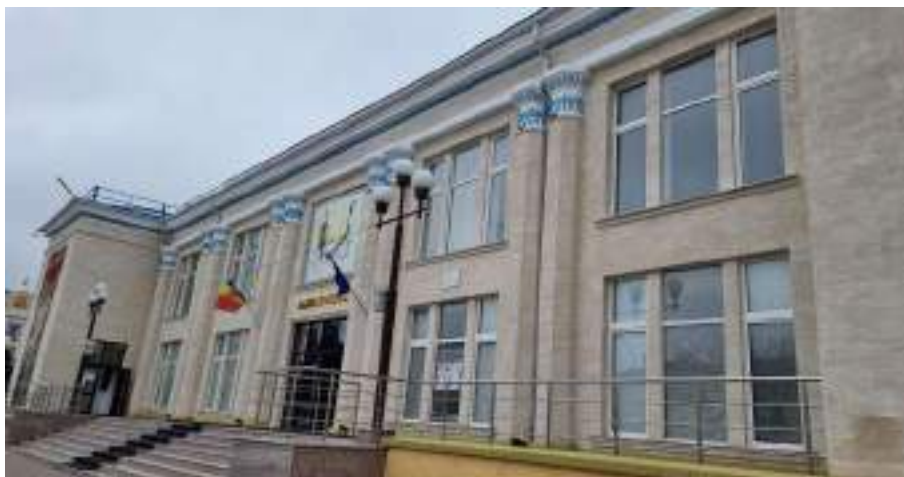
Fig. 6. Palatul de cultură din or. Hîncești, 1966. 2024.