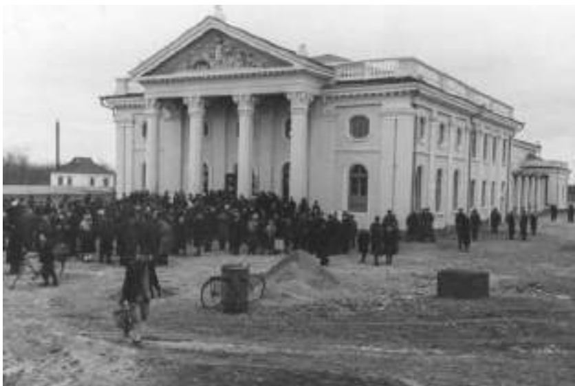
Fig. 3. Casa de cultură din s. Cioburciu, 4 noiembrie 1956 ( https://www.moldova.org/cum-aratau-casele-de-cultura-in-vremurile-lor-de-glorie/ ).