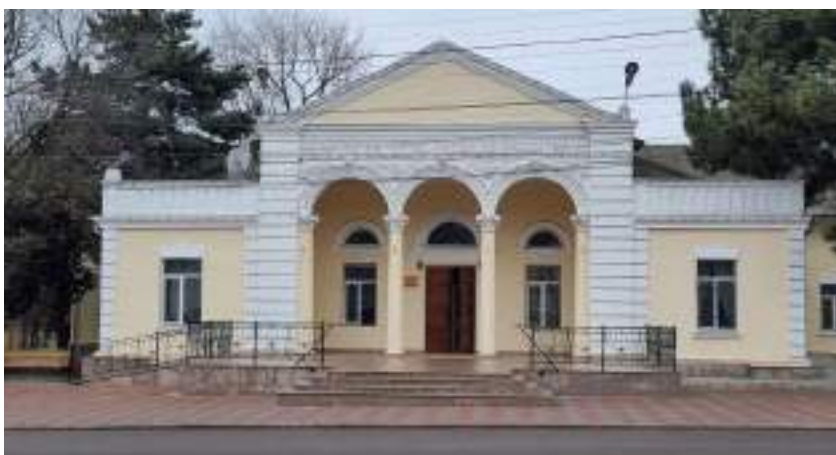
Fig. 5. Casa de cultură din or. Ialoveni, 1958. 2024.