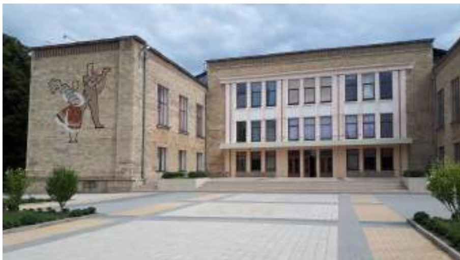
Fig. 7. Palatul de cultură din or. Bender (Tighina), 1962. 2024.