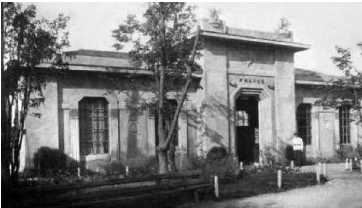
Fig. 8. Pavilionul Industriei Franceze (după Gh. Palade și M. Ursu).