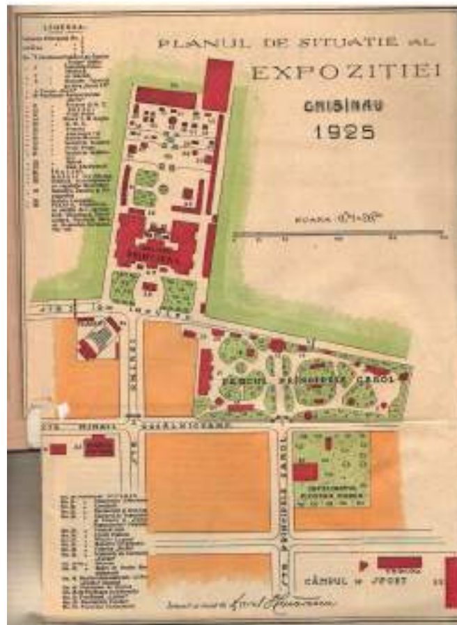
Fig. 2. „Planul de situație al expoziției Chișinău-1925”, anexat Catalogului Expoziției Generale a Basarabiei și a Târgului de Mostre, Chișinău, 1925.