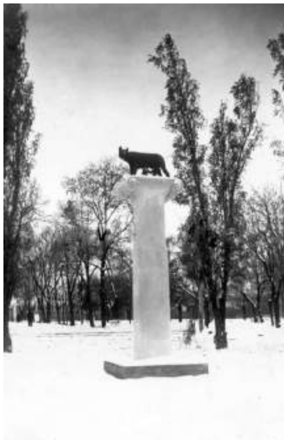
Fig. 17. Statuia Lupoicei instalată la intrare în Grădina Publică, Chișinău, 1942 (după Iu. Șveț).