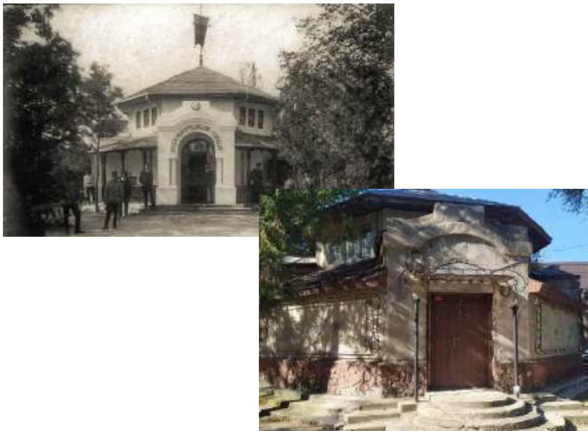
Fig. 5. Pavilionul Regiei Monopolurilor Statului (R.M.S.) în 1925 (a) (după Gh. Palade și Gh. Ursu); astăzi (b) (foto V. Șlapac).