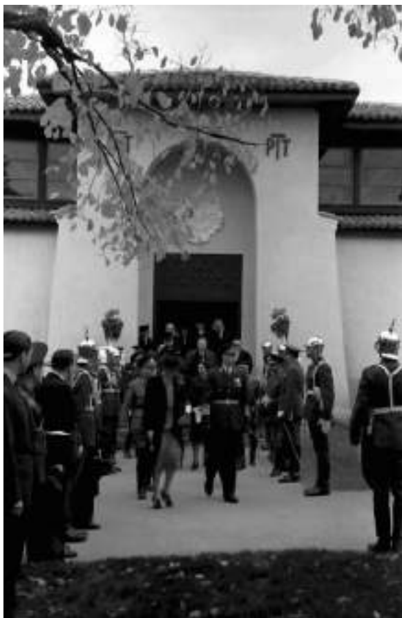
Fig. 16. Pavilionul „Poșta, Telefon, Telegraf” (P.T.T.) (după Iu. Șveț).