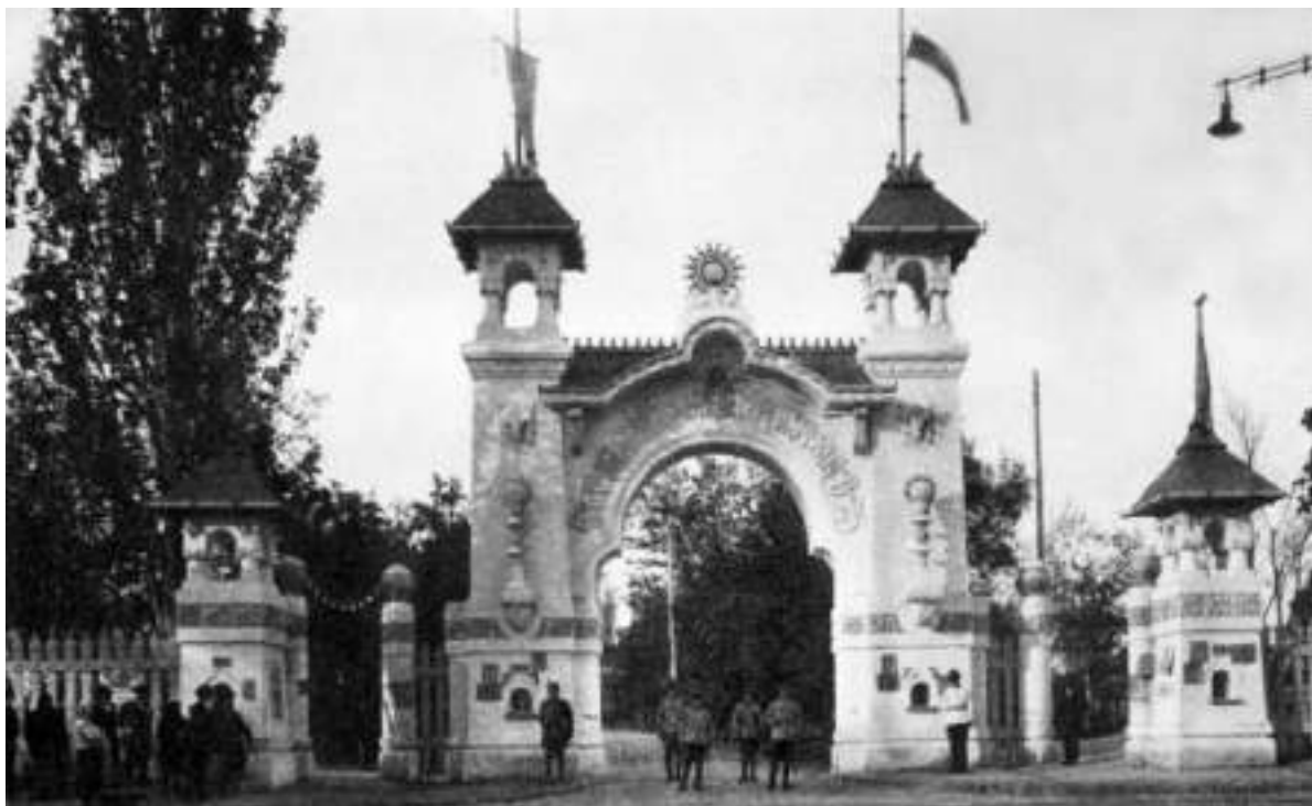
Fig. 3. Portalul principal al Expoziției situat în perspectiva str. Principele Carol, Chișinău, 1925 (după Gh. Palade și M. Ursu).