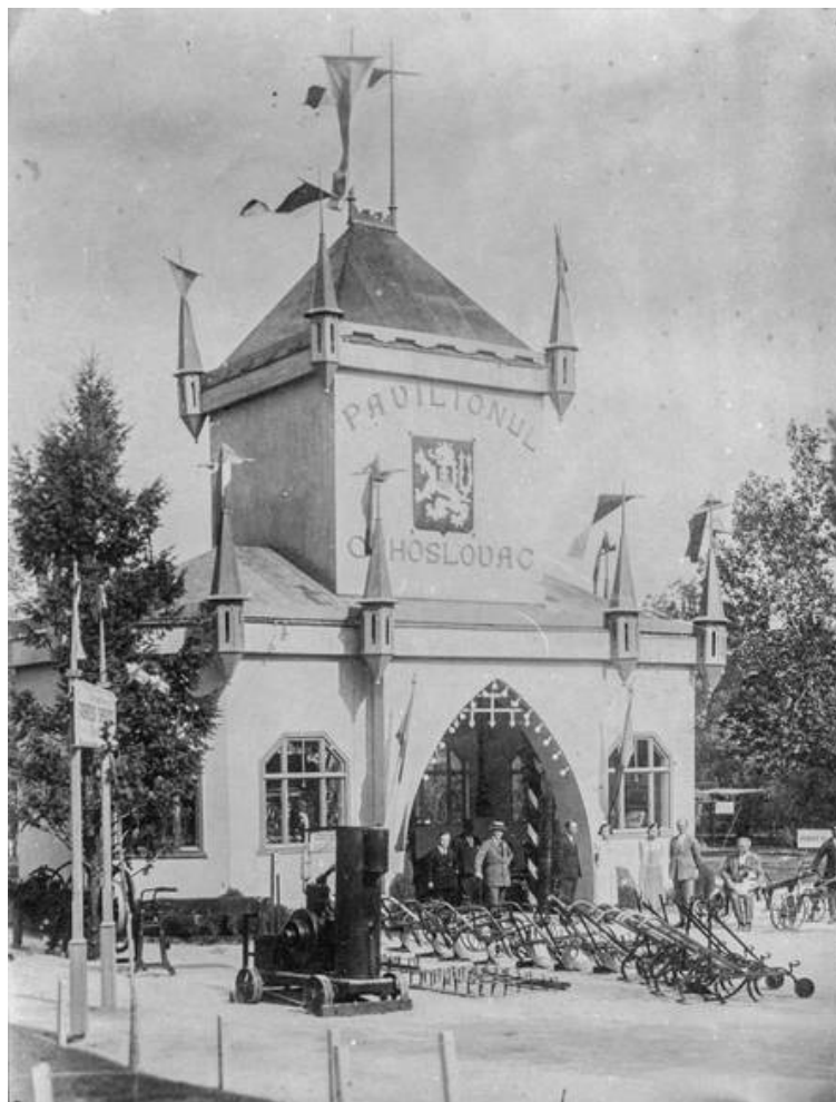
Fig. 9. Pavilionul Cehoslovac (după Gh. Palade și M. Ursu).