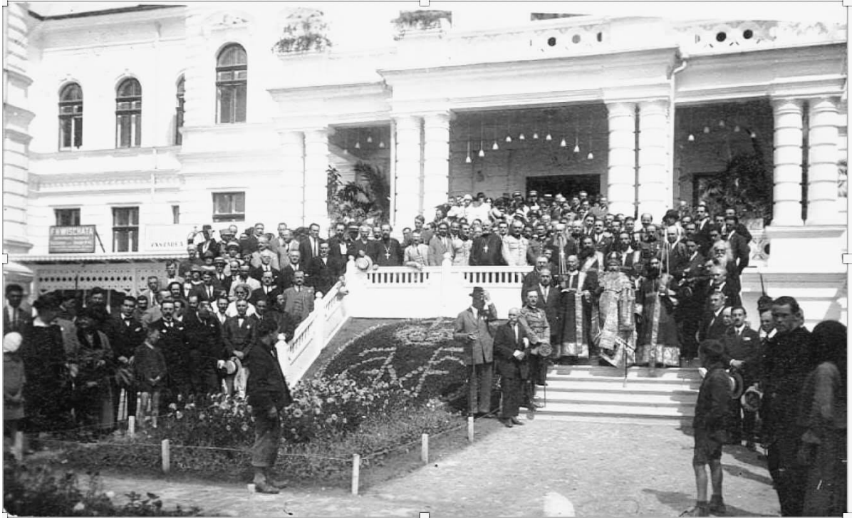
Fig. 1. Prima Expoziție Generală a Basarabiei și a Târgului de Mostre, Chișinău, 1925 (după Gh. Palade și M. Ursu).