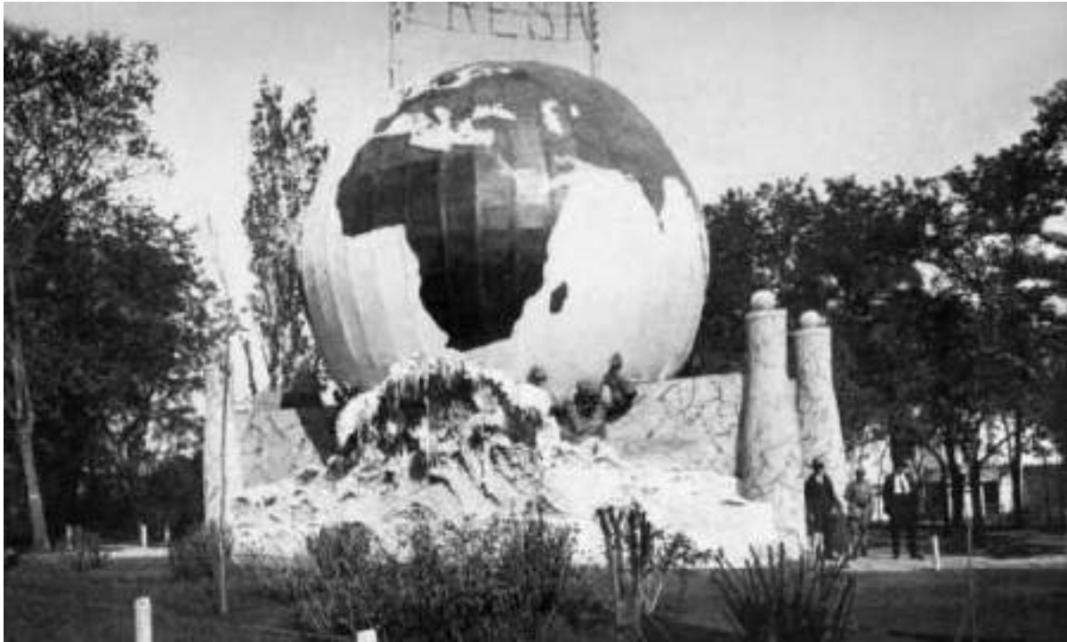
Fig. 7. Pavilionului Presei (după Gh. Palade și M. Ursu).