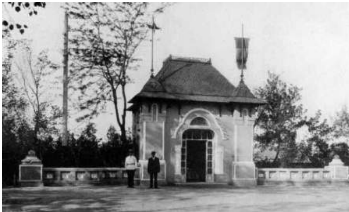
Fig. 6. Pavilionul „Towy Kogan” (după Gh. Palade și M. Ursu).