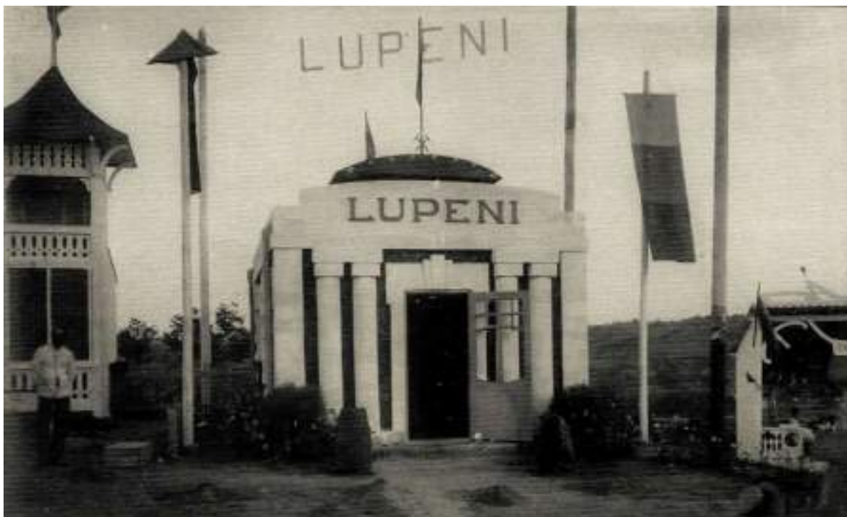
Fig. 4. Pavilionul Minelor Lupeni (după Gh. Palade și M. Ursu).