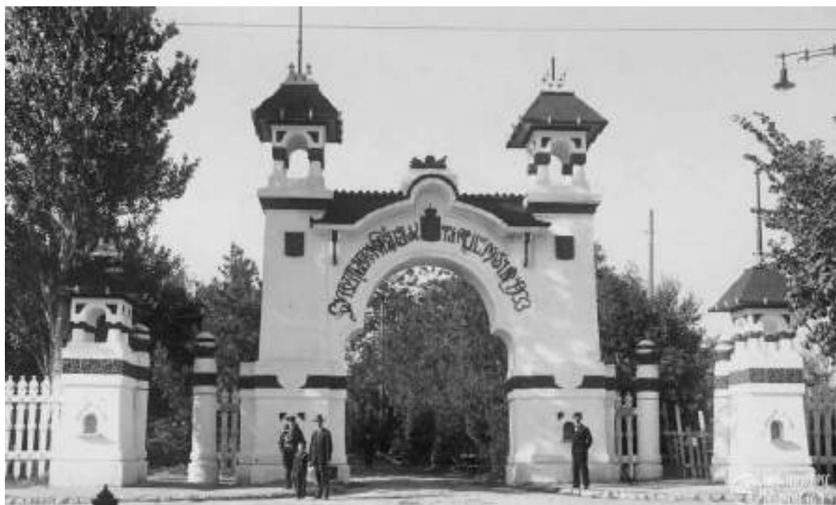
Fig. 11. Portalul principal al Expoziției Generale a Basarabiei, Chișinău, 1933.