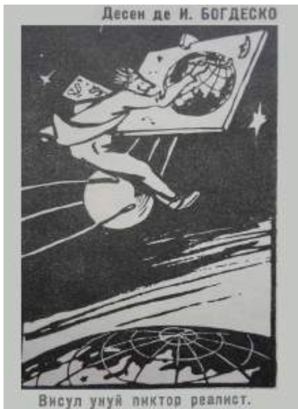
Fig. 3. Ilija Bogdesco. Visul unui pictor realist. Revista de satiră și umor „Chipăruș” nr. 3, februarie 1958.