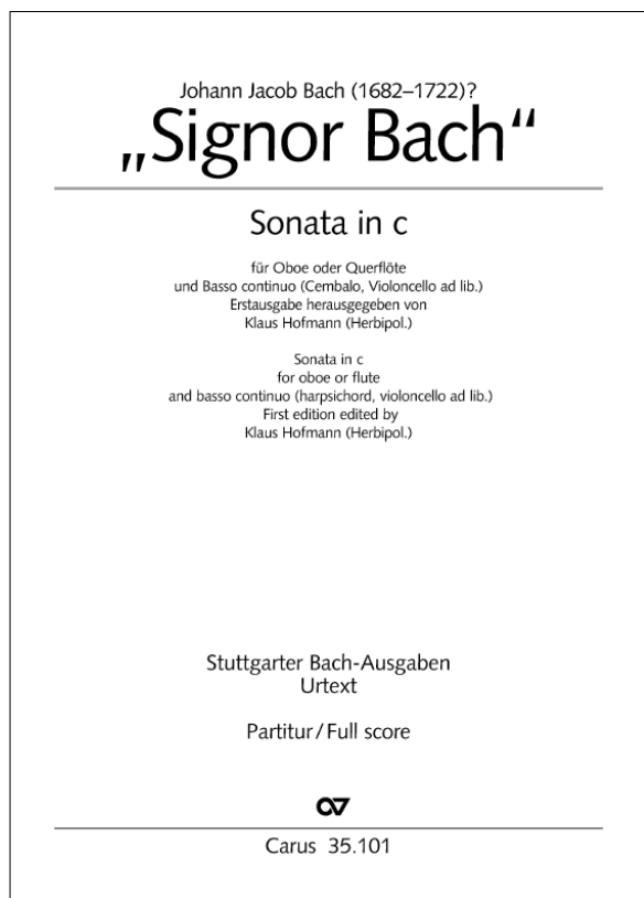
Foaia de titlu a partiturii Sonatei pentru oboi în do minor „Signor Bach”

regele nu putea comanda muzică din afară. El depindea de resursele proprii, adică de Jacob Bach și colegii săi. Este plauzibil să credem că influența mediului l-ar fi stimulat, de asemenea, în actul de creație, așa cum, fiind expus muzicii otomane (o curiozitate majoră pentru europenii secolului al XVIII-lea), Jacob ar fi putut experimenta, integrând elemente de „alla turca” în compozițiile sale, anticipând moda care avea să cuprindă Viena câteva decenii mai târziu.