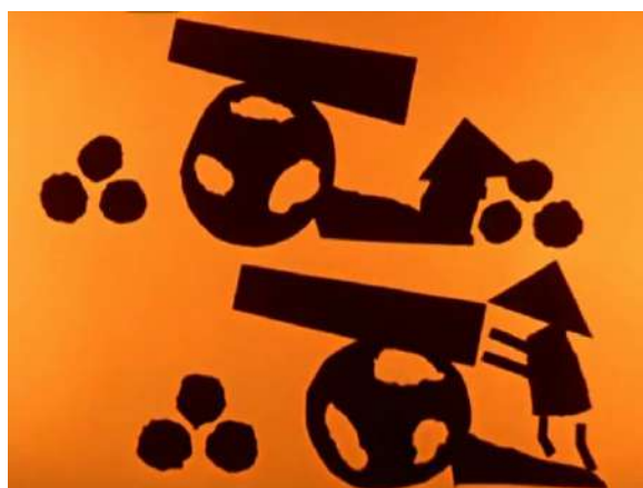
Igraszki (1962), regie Kazimierz Urbański