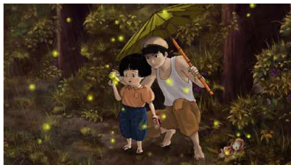
Mormântul licuricilor (1988), regie Isao Takahota