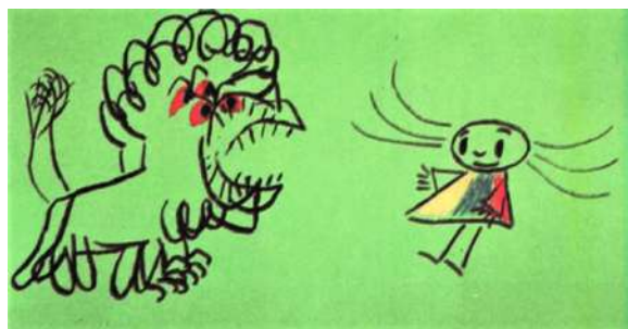
Jocul (Igra, 1962), regie Dušan Vukotić