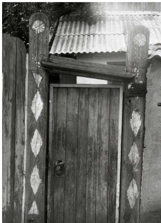
Fig. 10. Portiță, s. Lozova (r-l Strășeni). Foto V. Malcoci, 2000

Vitalie Malcoci (Chișinău, Republica Moldova). Doctor în studiul artelor, conferențiar universitar, Institutul Patrimoniului Cultural.