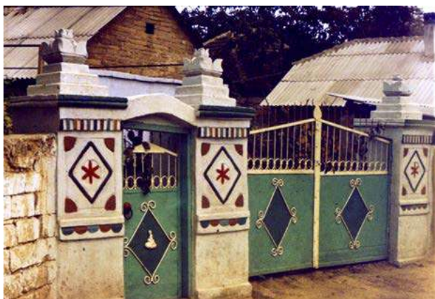
Fig. 5. Poartă, s. Butuceni (r-l Orhei). Foto V. Malcoci, 1998