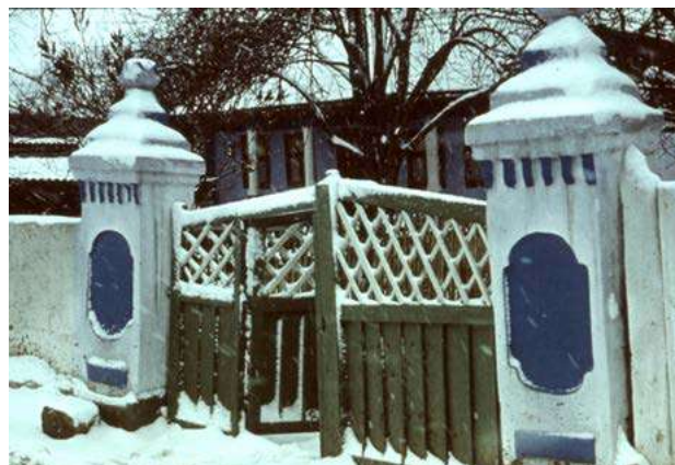
Fig. 2. Poartă, s. Brănești (r-l Orhei). Foto V. Malcoci, 1999