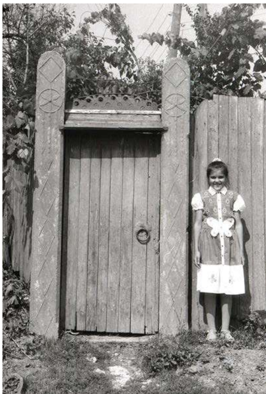
Fig. 7. Portiță, s. Lozova (r-l Strășeni). Foto V. Malcoci, 2000