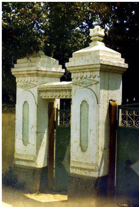
Fig. 8. Portiță, s. Brănești (r-l Orhei). Foto V. Malcoci, 2000