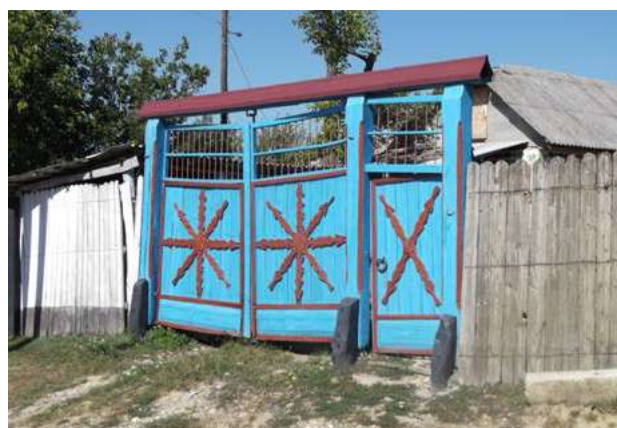
Fig. 4. Poartă, s. Vălcineț (r-l Călăraș).