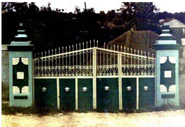
Fig. 1. Poartă, s. Jeloboc (r-l Orhei). Foto V. Malcoci, 2000