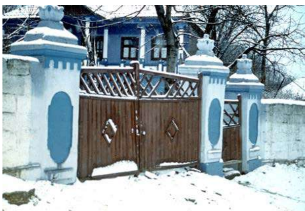
Fig. 3. Poartă, s. Brănești (r-l Orhei). Foto V. Malcoci, 1999