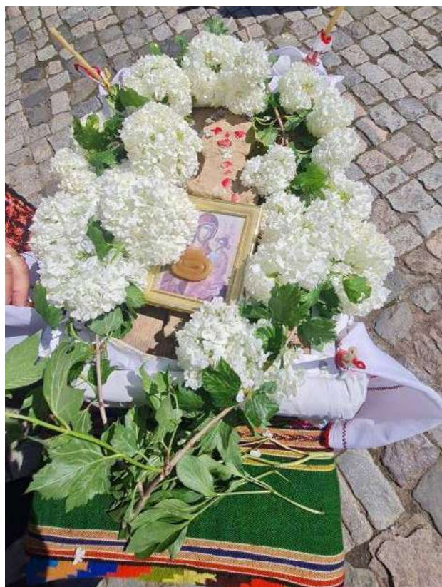
Foto 3. Caloianul realizat în satul Odaia Manolache, 2025, coordonator: Ecaterina Hulea.