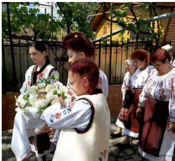
Foto 5. Drumul Caloianului către fântână, satul Odaia Manolache, 2025, coordonator: Ecaterina Hulea.