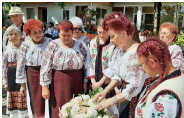
Foto 4. Bocirea Caloianului în satul Odaia Manolache, 2025, coordonator: Ecaterina Hulea.